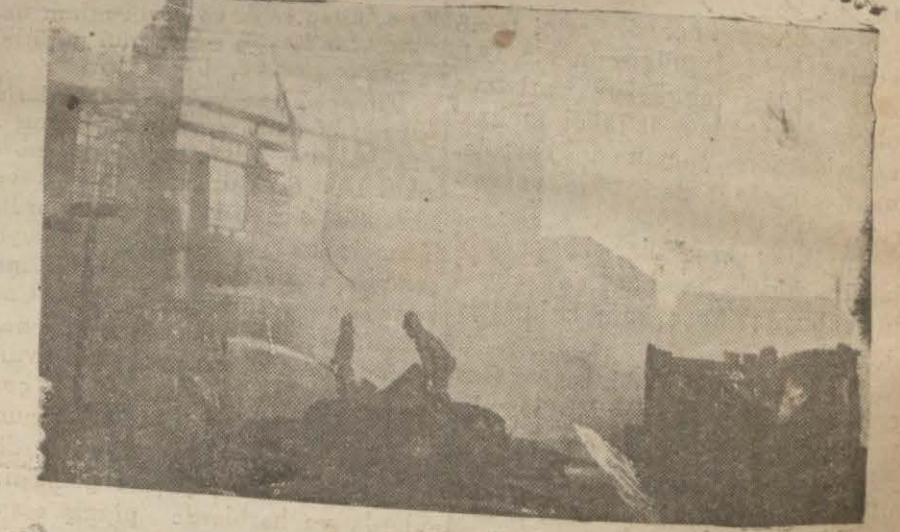
Dün akşamki yangından bir görünüş

Yangın esnasında iki amele yaralandı, bunlardan birinin hayatından endişe ediliyor