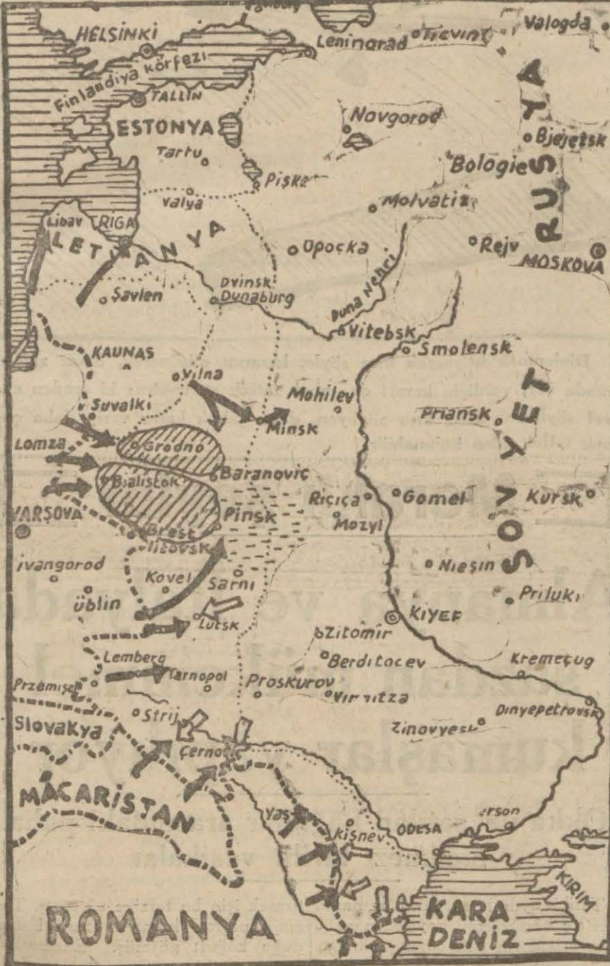
Merkez ve cenubda askerî vaziyeti gösterir harita

Berlin tebliği Karpatlarda ve Pripet bataklıklarının ötesinde Alman kıtaatının muvaffakiyetler kazandıklarını ve Leopold şehrine yaklaşıtlarını iddia etmektedir.